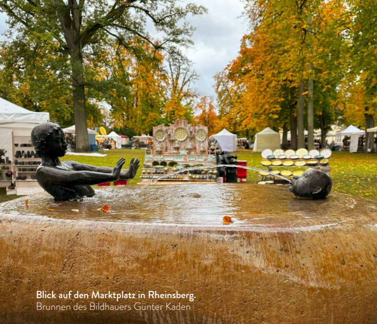
Blick auf den Marktplatz in Rheinsberg. Brunnen des Bildhauers Günter Kaden

Als Keramikstadt ist Rheinsberg bereits mehr als 250 Jahre weit über die Landesgrenzen hinaus bekannt. Auch heute leben und arbeiten hier immer noch Menschen, für die Lehm und Ton zum wirtschaftlichen, handwerklichen und künstlerischen Lebensmittelpunkt zählen. Sie freuen sich über Deinen Besuch.