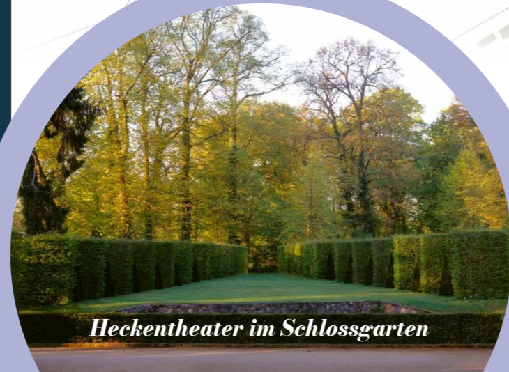
Heckentheater im Schlossgarten