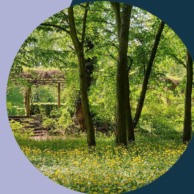
Gemswurzblüte im Schlossgarten am Heckentheater.

Gemeinsam mit dem Heimatverein Rheinsberger Seenkette e. V., der Musikkultur Rheinsberg gGmbH, der Stadt Rheinsberg und weiteren Akteuren lädt die Stiftung Preussische Schlösser und Gärten Berlin-Brandenburg zum 3. Rheinsberger Schlossgartenfest in den Lustgarten ein.